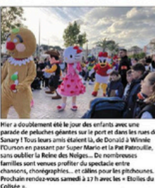
Mier a doublement été le jour des enfants avec une parade de peluches géantes sur le port et dans les rues de Sanary ! Tous leurs amis étaient là, de Donald à Winnie l'ourson en passant par Super Mario et le Père Noël, sans oublier la Reine des Neiges... De nombreuses familles sont venues profiter du spectacle entre chansons, rhodogéants... et ballons pour les plus jeunes. Prochain rendez-vous samedi 17 à Venon - B. L.