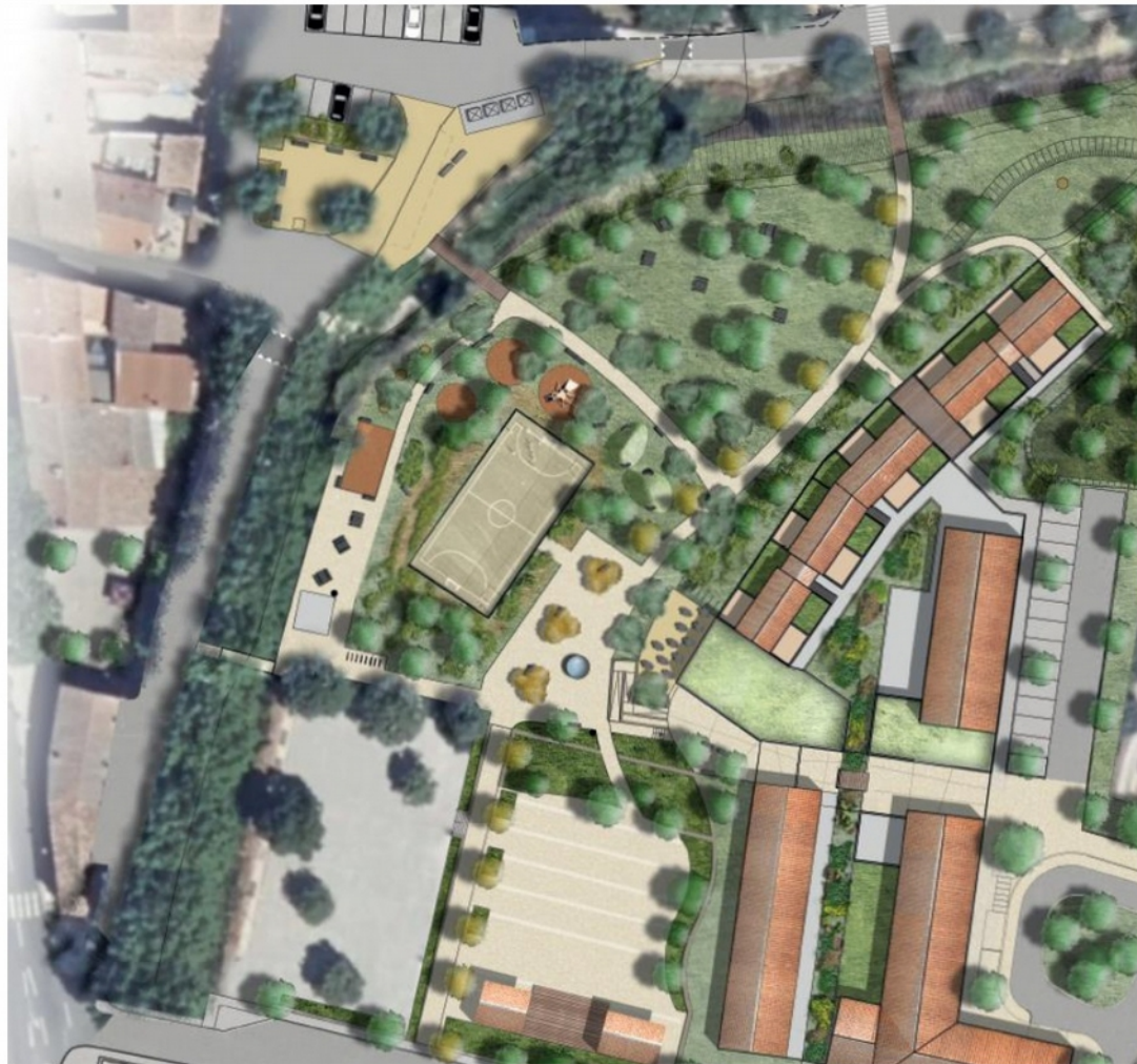
Plan prévisionnel du parc paysager